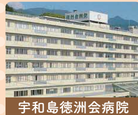
宇和島徳洲会病院