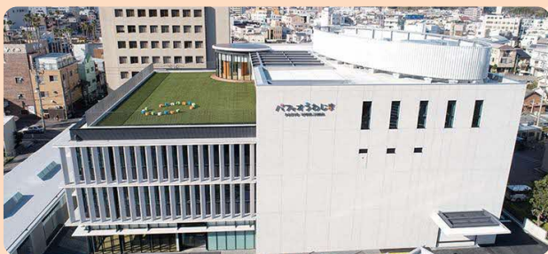
パフィオ 4階 (子育て世代活動支援センター) 鶴島町