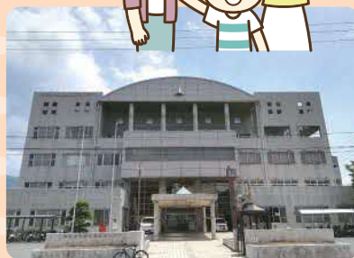
総合福祉センター 2階 (児童交流センター) 住吉町