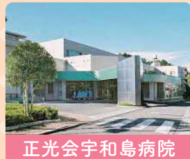
正光会宇和島病院